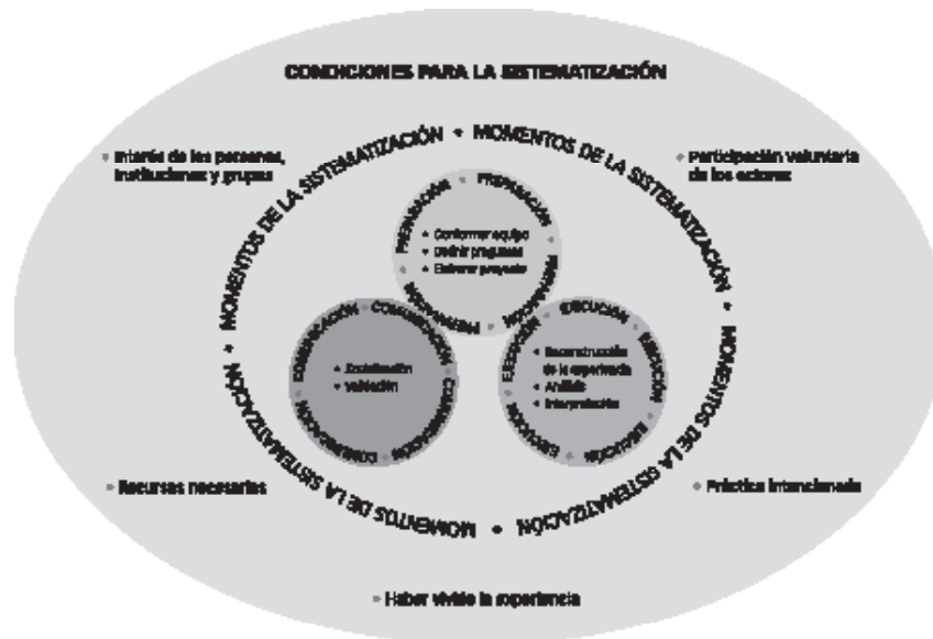
Figura 1. Momentos de la sistematización