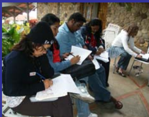
Encuentro Nacional de Coordinadores. La Grita, Edo.

Algunos criterios que definen lo que es una experiencia significativa en la Fundación Infocentro, son: