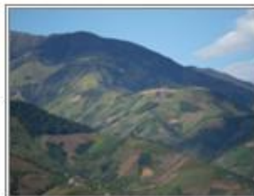
Estado Táchira, Venezuela.

La Fundación CIARA (Capacitación e Innovación para el apoyo de la Revolución Agraria), adscrita al Ministerio del Poder Popular para la Agricultura y Tierras, es el ente promotor de la conformación de Cajas Rurales en Venezuela. Desde el año 2000 inició esta experiencia mediante la capacitación y el apoyo a la organización de comunidades campesinas, para luego otorgar préstamos e incentivar el ahorro entre productores y productoras rurales, y así fomentar el desarrollo local. Actualmente se cuentan más de 380 Cajas Rurales en todo el territorio nacional, siendo éstas expresiones de la profundización de la organización popular en nuestro país.