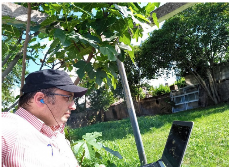
Imagen 4. Docente en clases virtuales a través de una plataforma on-line, a la sombra de los árboles. Instituto de Formación Docente, Tacuarembó, Uruguay, 2021.

La “sombra” o “las sombras” (ya no de los árboles), se convierten en límites, en miedos, en obstáculos que sólo habitan en nuestras mentes exigiéndonos liberación. Como Calibán se liberaba de Próspero en la Tempestad de Shakespeare, acudiendo a la ayuda de Ariel (otro de los oprimidos con espíritu libre). El colonizador, Próspero no sólo los oprimía, sino también les alimentaba, les cuidaba y hasta les enseñaba su propio idioma colonizador. Pero el oprimido, cuando aprende su lengua, cuando descubre, cuando despierta nota lo que buscaba el opresor: poder, riquezas, fama, etc. En ese momento, el oprimido, inicia su proceso de liberación. Freire cuenta que, en una de las visitas de trabajo a Cabo Verde, tuvo la oportunidad de oír un discurso del presidente Aristedes Pereira que decía: “escuchó “Expulsamos al colonizador, pero precisamos ahora descolonizar nuestras mentes” (...) En el fondo, la lucha de la liberación –como decía Amílcar Cabral- ‘es un hecho cultural y un factor de cultura” (Freire, 2013, 111).