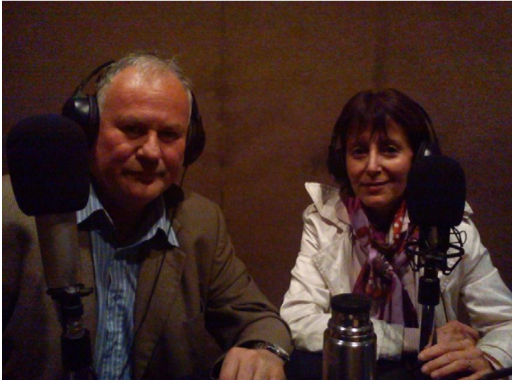
Imagen 3. Docentes directivos líderes de Chile realizando una experiencia de radio para fortalecer las relaciones interpersonales al interior de los equipos en un programa de posgrado en Formación en Liderazgo (2011).

“Mi Función en la escuela sólo es entregar contenidos, hoy declaro mi quiebre, me doy cuenta que he estado todo este tiempo adoctrinando y no educando, la educación está en todos los lugares, la educación se encuentra en cualquier acción de nuestra vida diaria, como dice Pablo Freire, en el pasado las plazas eran lugares de aprendizaje y sociabilización” (PARTICIPANTE D, Bitácora n°4, 18/12/2014).